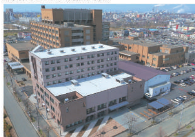
釧路労災看護専門学校 空撮

〒085-0052 北海道釧路市中園町13番38号 TEL 0154-25-9817 FAX 0154-32-3012