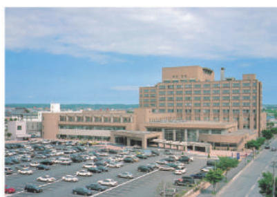
釧路ろうさい病院外観