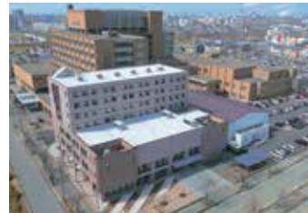
釧路労災看護専門学校 空撮

〒085-0052 北海道釧路市中園町13番38号 TEL 0154-25-9817 FAX 0154-32-3012