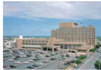
釧路ろうさい病院外観