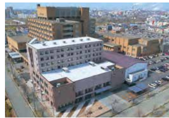
釧路労災看護専門学校 空撮

〒085-0052 北海道釧路市中園町13番38号 TEL 0154-25-9817 FAX 0154-32-3012