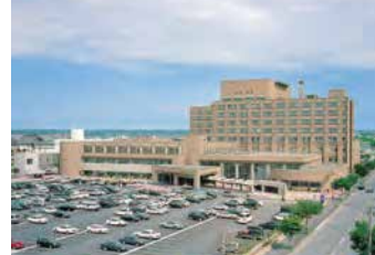
釧路ろうさい病院外観