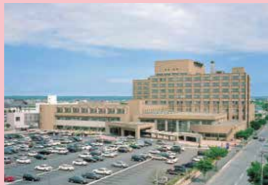
釧路労災病院外観