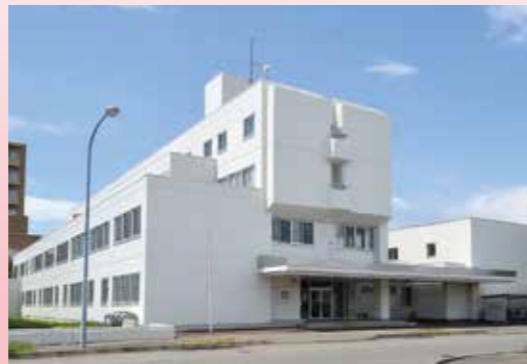
釧路労災看護専門学校 校舎外観