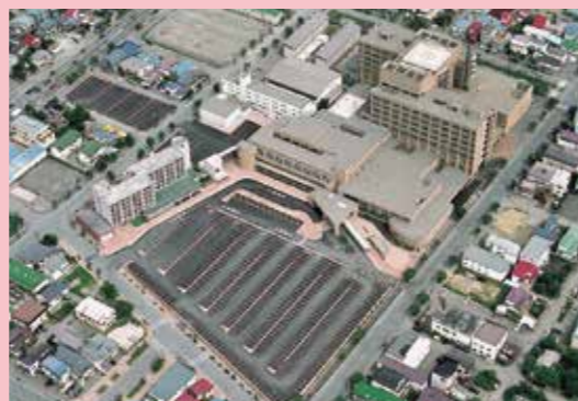
釧路労災看護専門学校 空撮